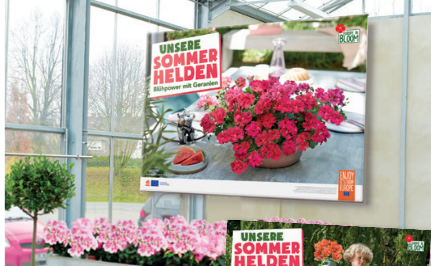
Motiv „Geranienpower“ (Die Abbildung zeigt das Größenverhältnis eines XXL-Banners.)

Kleine Helden im Großformat! Mit den Großbannern finden Sie Ihre perfekte Werbelösung. Durch eine Auswahl an verschiedenen Materialien und unterschiedlichen Größen sowie drei aufmerksamkeitsstarken Motiven lässt sich der Banner auf Ihre Bedürfnisse konzipieren.