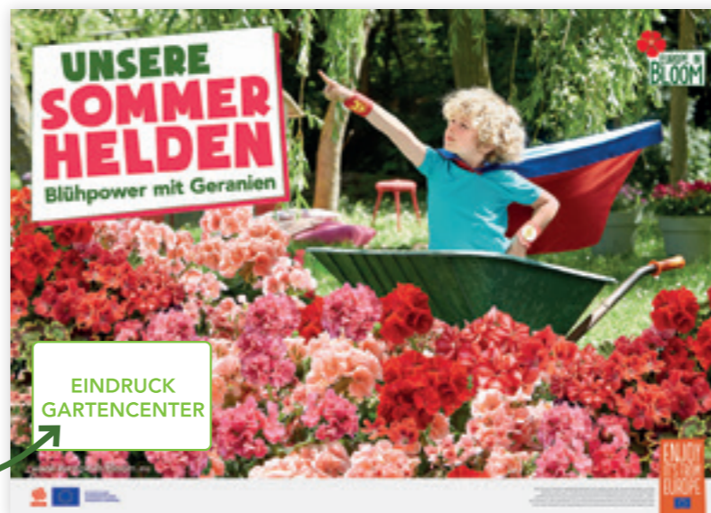
Motiv „Kleine Helden“

Firmeneindruck, farbig, unten links: einmalig 80 €* Format: 3,56 x 2,52 m, in 4er-Teilung