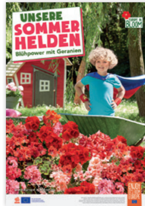
Motiv „Kleine Helden“